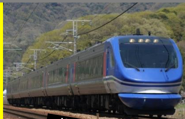
超級白兔號 Super Hakuto